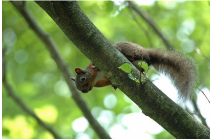
ニホンリスの写真