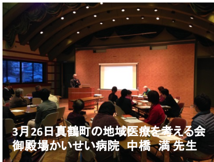
3月26日真鶴町の地域医療を考える会 御殿場かいせい病院 中橋 満先生