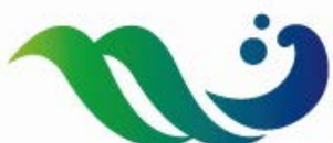
真鶴町国保診療所の新しいロゴマーク