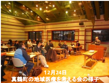
12月24日 真鶴町の地域医療を考える会の様子