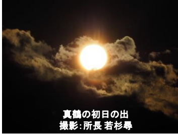
真鶴の初日の出