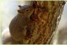
配島光男さんの作品