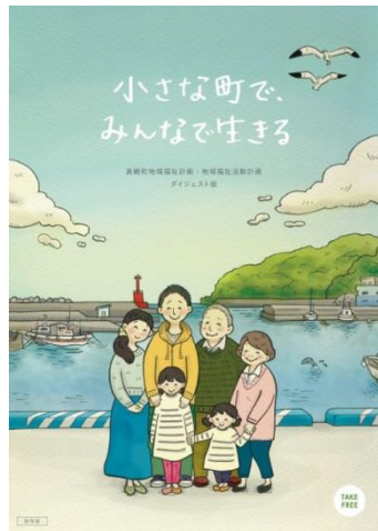
ダイジェスト版（全戸配布予定）