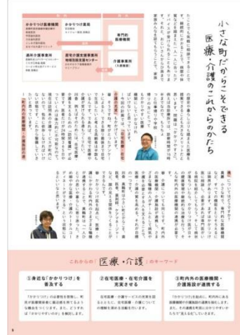
ダイジェスト版（医療介護のページ）