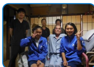
訪問診療同行で患者さんのご自宅にて