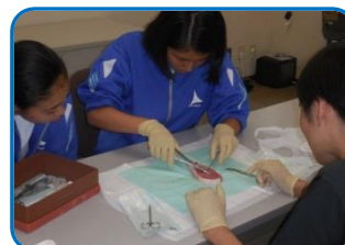
手術器具と豚肉を使って、 外科縫合体験