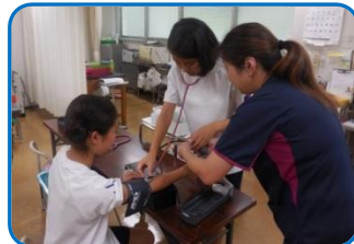
看護師指導のもと、 血圧測定体験