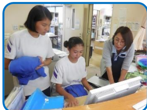
受付体験で保険証について学びました