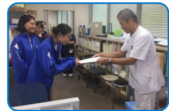
最後は修了証書の授与、お疲れ様でした!