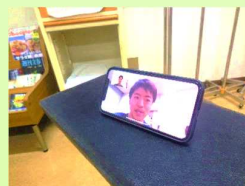
スマートフォンはこの様な画面が映ります