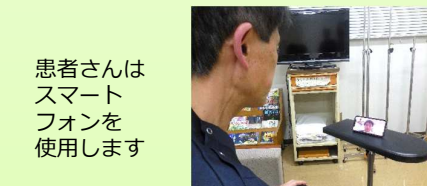
患者さんはスマートフォンを使用します