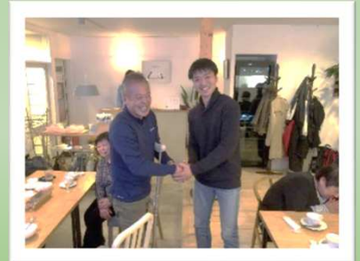
新旧の管理者同士で握手