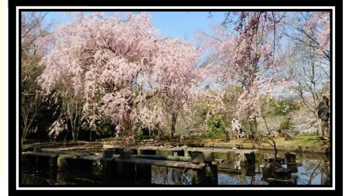
荒井城址公園のしだれ桜