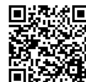
ナーシングホーム真鶴