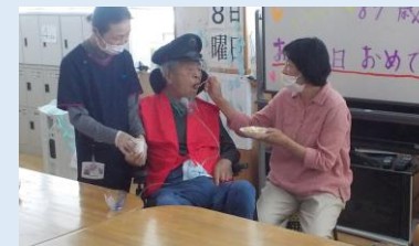
大好きなケーキを娘さんから食べさせてもらいました！

K様：介護する人も亡くなった人の家族も話を出来る場面があればいいかなと思います。家族会みたいな繋がる場所があるといいですね。「大丈夫。大丈夫。何とかやるよってしてくれる人が必要なのかな」。介護する人もされる人も頑張りすぎるのもよくないし、頑張らなくてもどうにでもなる、どうにもならないときはナーシングさん、呼べばいいやって思える介護がいいかなと思います。